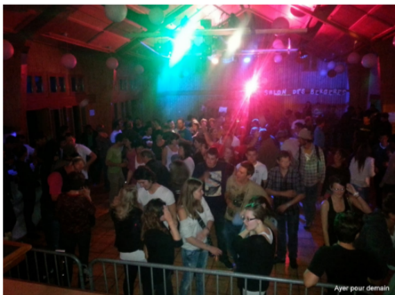
Bal des bergères au Foyer Lyrette le 22 septembre 2013

Dès 22h – Entrée libre – Sortie de secours